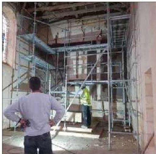
L'église a retrouvé son éclat!

BLAYE. Après cinq ans à la manœuvre, l'association Confluences lance un appel aux dons pour terminer les travaux de l'église Sainte-Luce, qui pourrait, à terme, accueillir de nombreuses manifestations culturelles.