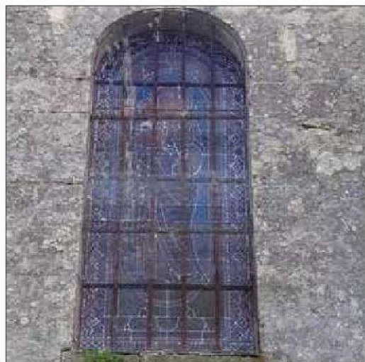
Six vitraux sur neuf ont été restaurés.